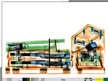
Code matériaux sur 6 couleurs