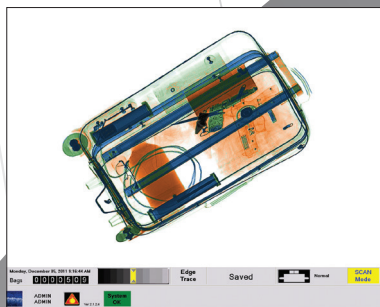
Code matériaux sur 6 couleurs